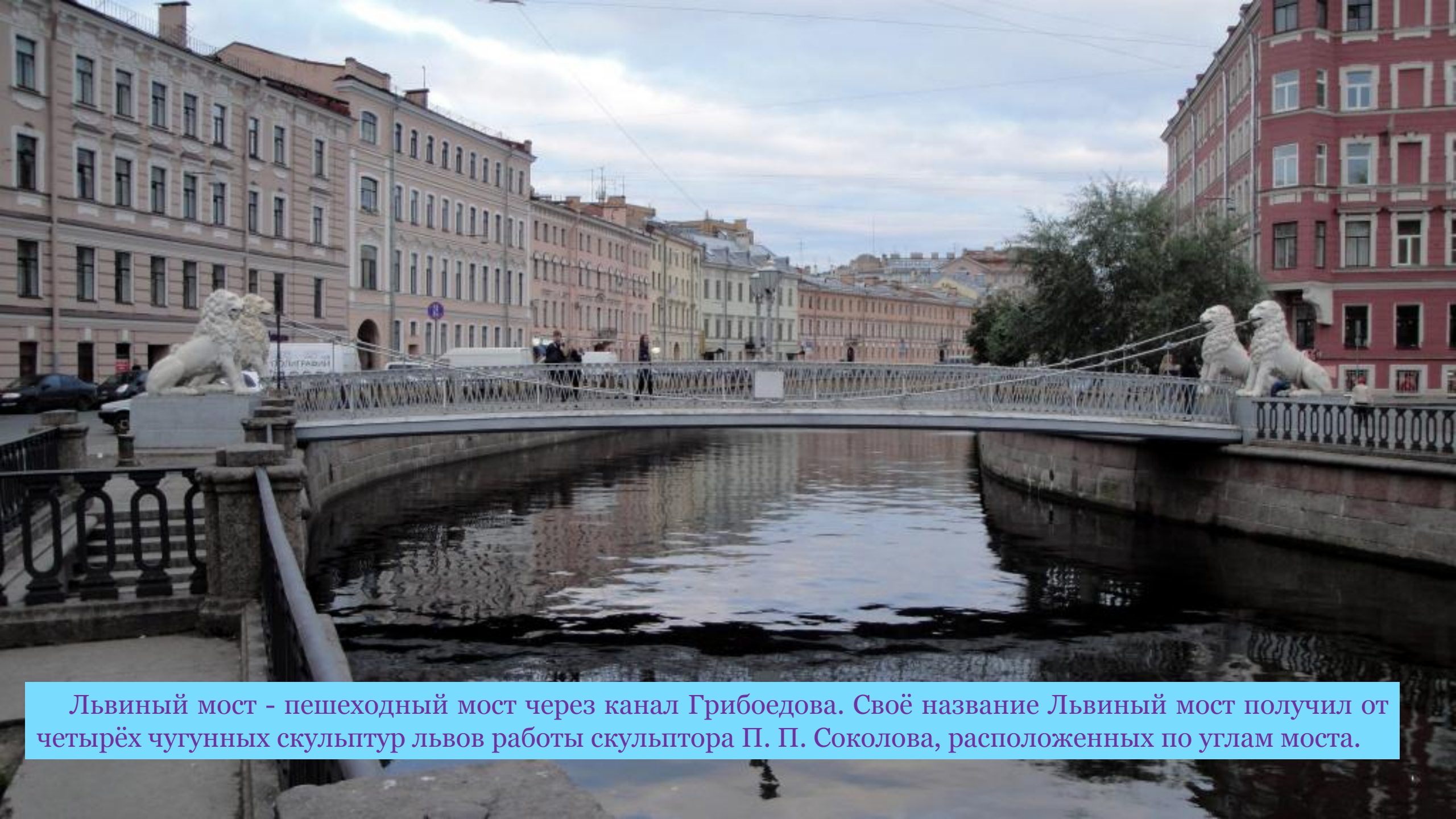
Львиный мост - пешеходный мост через канал Грибоедова. Своё название Львиный мост получил от четырёх чугунных скульптур львов работы скульптора П. П. Соколова, расположенных по углам моста.