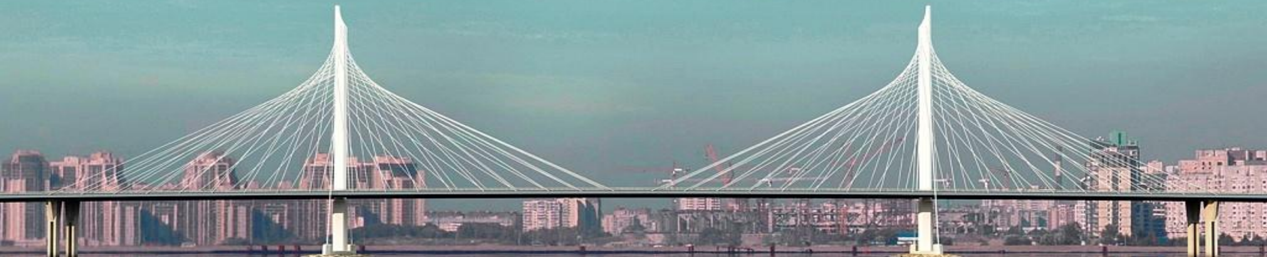
Вантовый мост через Петровский фарватер