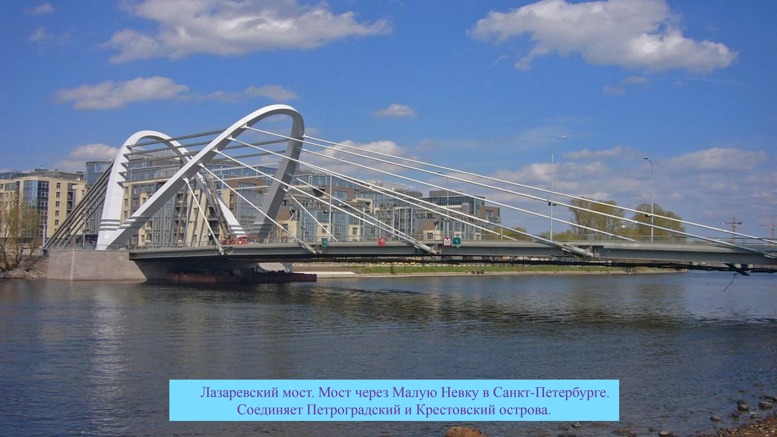
Лазаревский мост. Мост через Малую Невку в Санкт-Петербурге. Соединяет Петроградский и Крестовский острова.